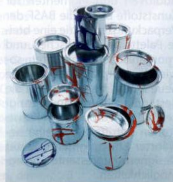
Bestens geeignet als Verpackungsmaterial für Farben, Lacke und Holzschutzmittel.

Ein Online-Shop des Bereichs Decorative richtet sich an Gewerbetreibende, die unkompliziert im Internet Schmuckdosen in kleineren Verpackungseinheiten bestellen wollen. Die Seite bietet zurzeit eine Auswahl von über 80 Varianten.