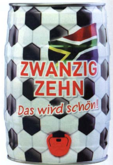
Zwanzigzahn, das wird schön! Was wäre eine Fußballparty ohne das Selbstgezapfte?

Der Geschäftsbereich Decorative hat sich innerhalb der Packaging Group auf dekorative Weißblechverpackungen spezialisiert und bietet dort mit über 500 Formen eine große Auswahl. Neben der auftragsbezogenen Fertigung bei größeren Mengen beziehen die Abnehmer kleinerer Stückzahlen ihre Dosen über einen Onlineshop direkt ab Lager und können diese zusätzlich individualisieren lassen. Ob nachträgliche Prägung, Lasergravur, Bedruckung oder Labeling, mit diesen Verfahren können neutrale Weißblechdosen auch bei kleinen Stückzahlen individuell und verkaufsfördernd gestaltet werden. Die Kompetenz der Huber Packaging Group im Blechdruck zeigt sich nicht nur in Form von fertig bedruckten und geformten Weißblechverpackungen, sondern im gesamten Prozess vom Eingang der Kundendaten bis zum Druckergebnis. Als erstes Unternehmen in Europa setzt es nun eine Digitaldruckmaschine des japanischen Herstellers Mimaki ein, die einen farbverbindlichen Proof auf